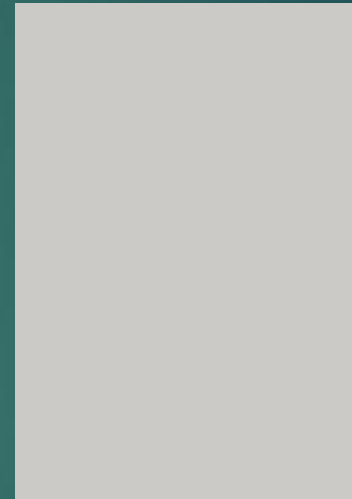
ЕМАЛІТ 7044 світло сірий супермат